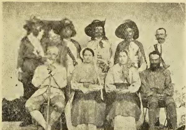
Los actores del drama «La Hija del Anciano» recitado en ocasión del 1.º aniversario de Nin y Silva»